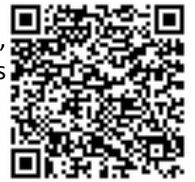
Instruções de instalação

A instalação deve ser feita de acordo com as instruções gerais da ROTO.